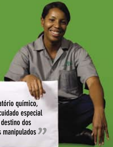
Heni Gratto Técnica gráfica

“ No laboratório químico, tenho um cuidado especial com o destino dos produtos manipulados ”